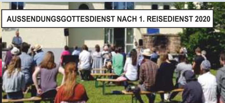
AUSSENDUNGSGOTTESDIENST NACH 1. REISEDIENTST 2020